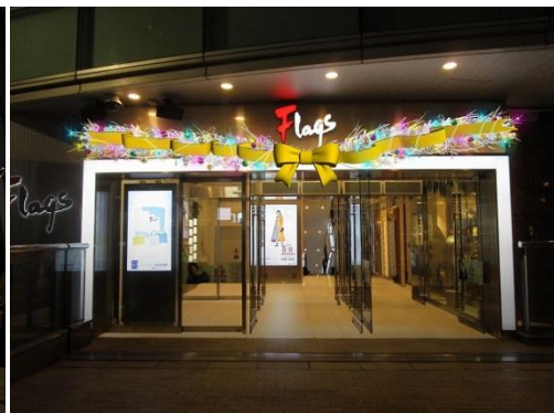
<Flags(フラッグス) 2階エントランス>