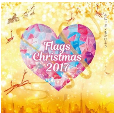
<コンセプトアート>