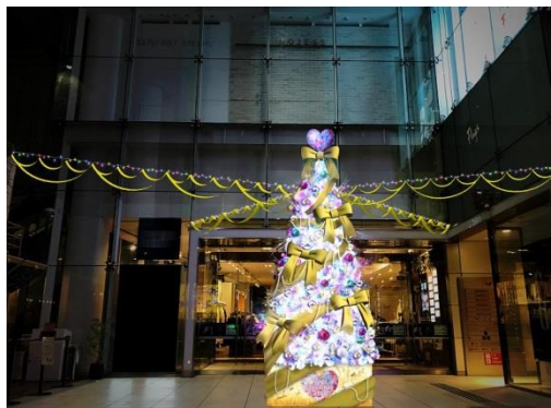
<Flags(フラッグス) 1階エントランス>